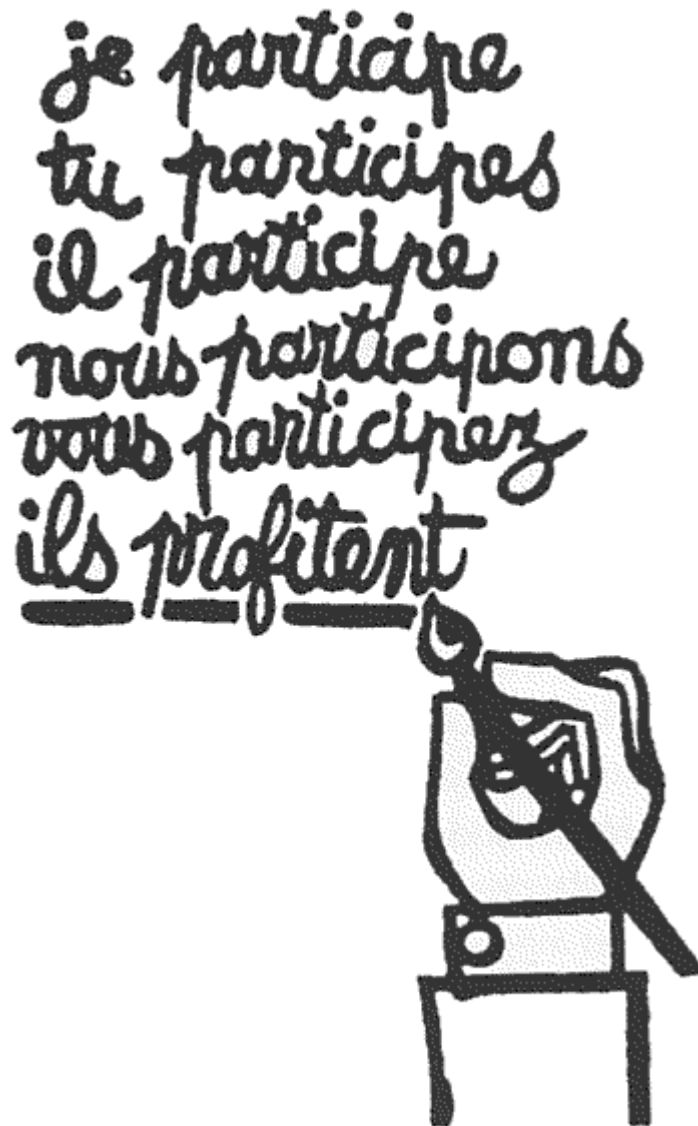
Fig 1. Poster : Ik participeer, gij participeert, hij participeert, wij participeren, gij participeert,.. Zij profiteren.

Originally Published as Arnstein, Sherry R. "A Ladder of Citizen Participation" JAIP, Vol. 3, No 4, July 1969, pp 216-224 . I do not claim any copyrights.